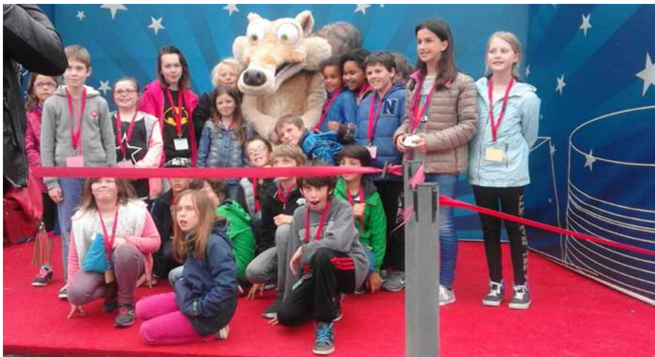
Un des groupes de l'école dans le vif du sujet des attractions lors de la visite du Futuroscope de Poitiers